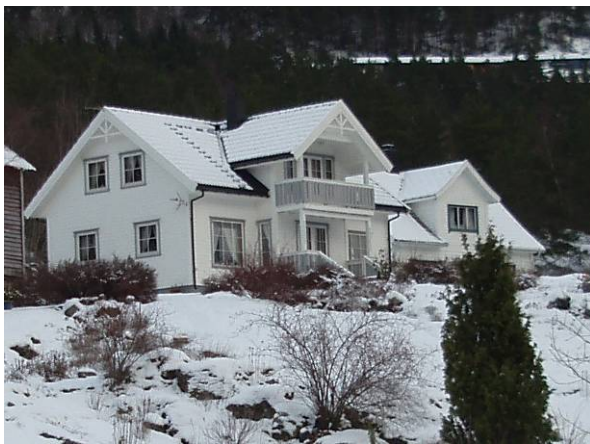
Frå Eidsfjorden i sør-vest

Rådmannen viser til at bygget ikkje er synleg frå huset mitt, det vil seie frå nord. Rådmannen burde kjenne til at det finst fleire himmelretningar som også burde takast med i vurderinga av estetisk utforming! Dei to bileta nedanfor viser fasadane mot Eidsfjorden.