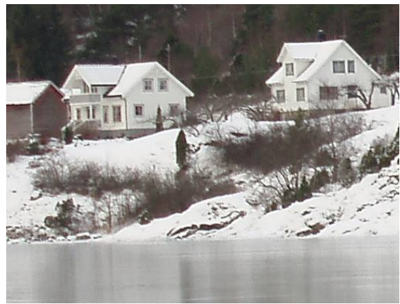
Frå Eidsfjorden i sør-aust