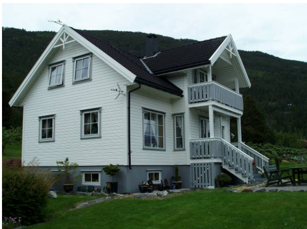
Huset i dag